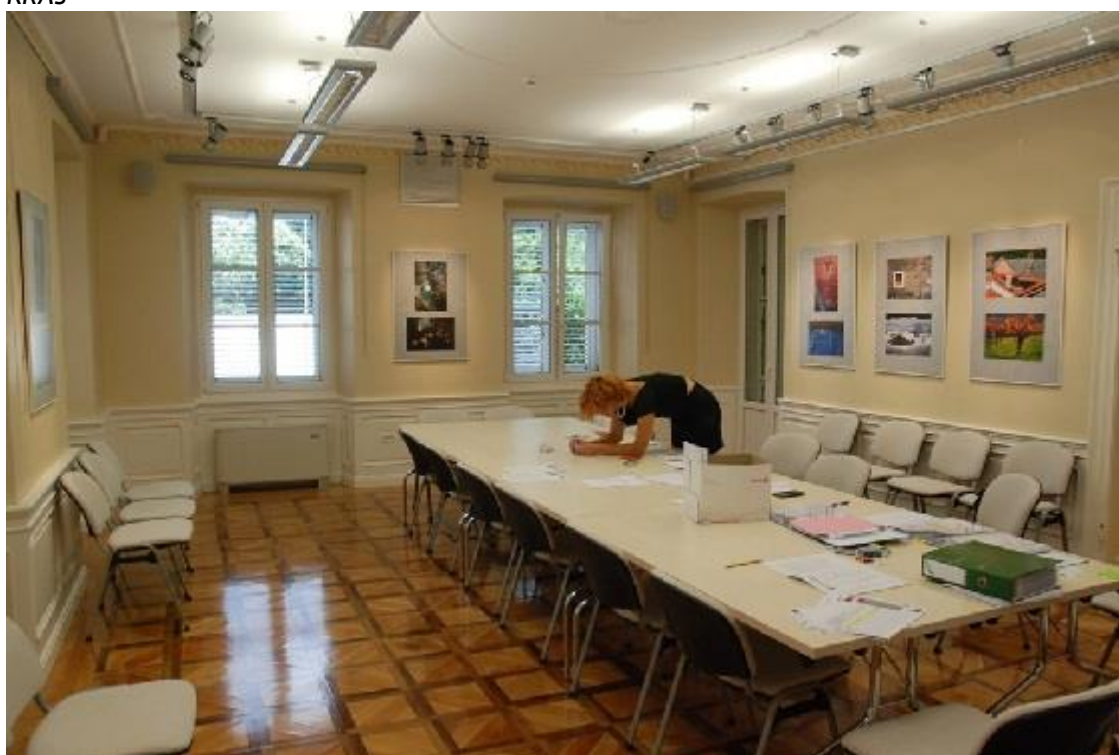
Sala per rii e mostre del Centro informativo del Carso