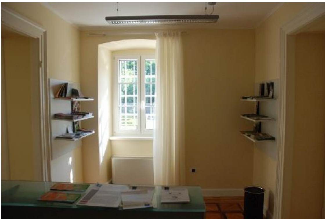
Ufficio ricevimento del Centro informazioni turistico