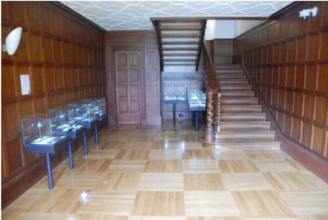
L'atrio con la raccolta dei fossili dal corso classico del collezionista Viktor Saksida