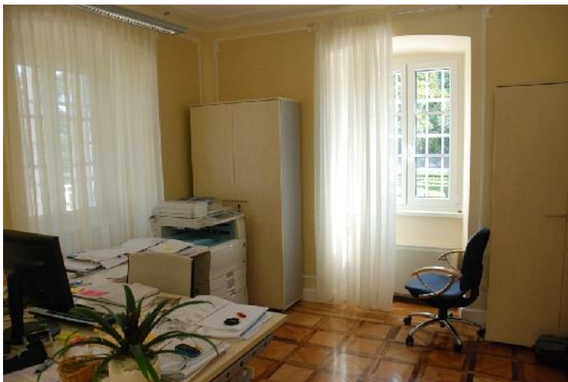
Ufficio del Centro informativo del Carso, al momento dedicato all'attuazione del progetto CARSO-KRAS